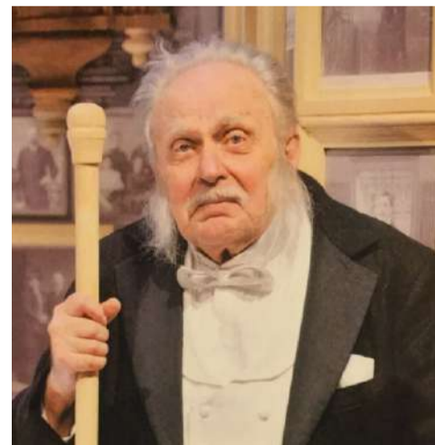
В роли Фирса

Так что да, очень престижно. Но с другой стороны, центр за эти годы так приелся, что я уже не знаю, куда уйти, чтобы разнообразить свою прогулку. Куда не выйдешь, везде надоевшие улицы – исторические, красивые, но надоевшие. Пешком не уйти, только на метро или на автобусе можно выбраться на какой-то простор.