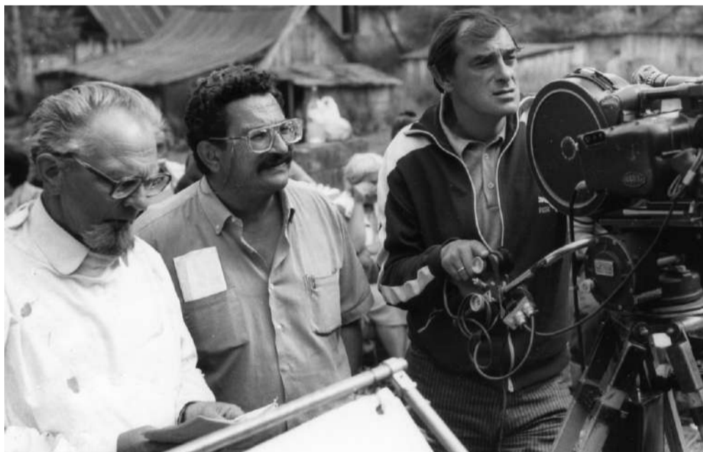
На съемках фильма

– Вы знаете, ничего не предвещало. Отец мой был директором металлургического техникума. Мама работала в какой-то химлаборатории, тоже при металлургическом заводе. То есть они были из инженерно-технических работников и никакого отношения к искусству не имели. Мы жили в доме с натуральным хозяйством, держали корову,