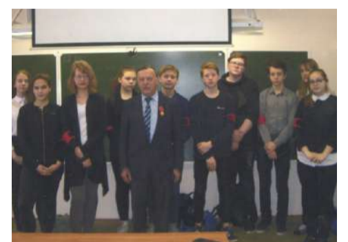
Уроки мужества в школах